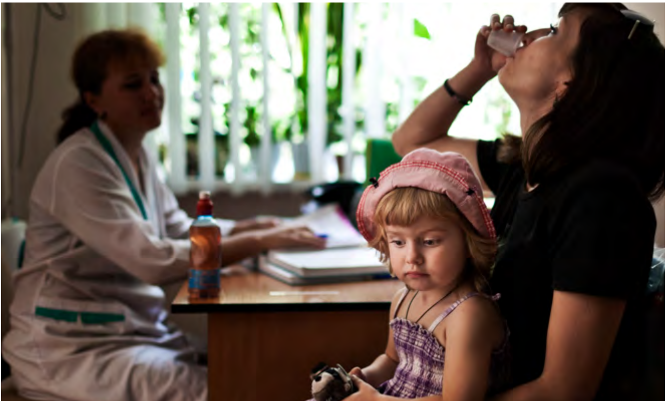
Mujer recibiendo dosis de metadona en Ucrania.

Los temores y los conceptos erróneos sobre la adicción han contribuido a la opinión de que las personas que consumen drogas deben ser obligadas a recibir un tratamiento en contra de su voluntad. En varios países, esto se traduce en un tratamiento ordenado