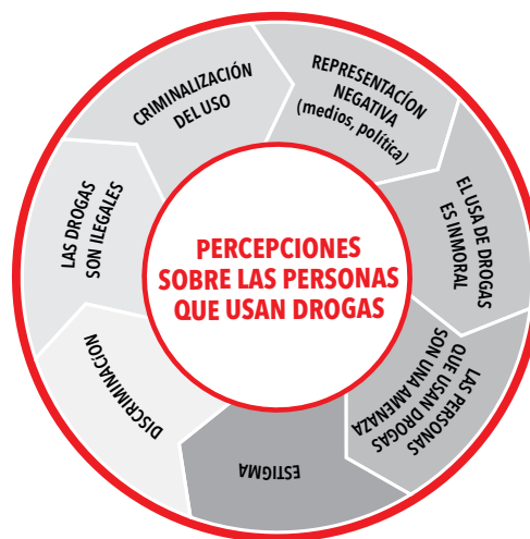
FIGURA 3: CÍRCULO VICIOSO DE LA PERCEPCIÓN SOBRE LAS PERSONAS QUE USAN DROGAS

otras a la vez que contribuyen y perpetúan el estigma asociado con el uso de drogas y las drogas en sí. Ninguna condición médica es más estigmatizada que la "adicción". 81 Como se muestra arriba, la percepción pública es que el uso de drogas, incluido el uso problemático de drogas, es una elección y que las personas eligen no controlarlo, es decir, no detenerse y, por eso mismo, la sociedad en general no permite la presencia de ningún factor atenuante.