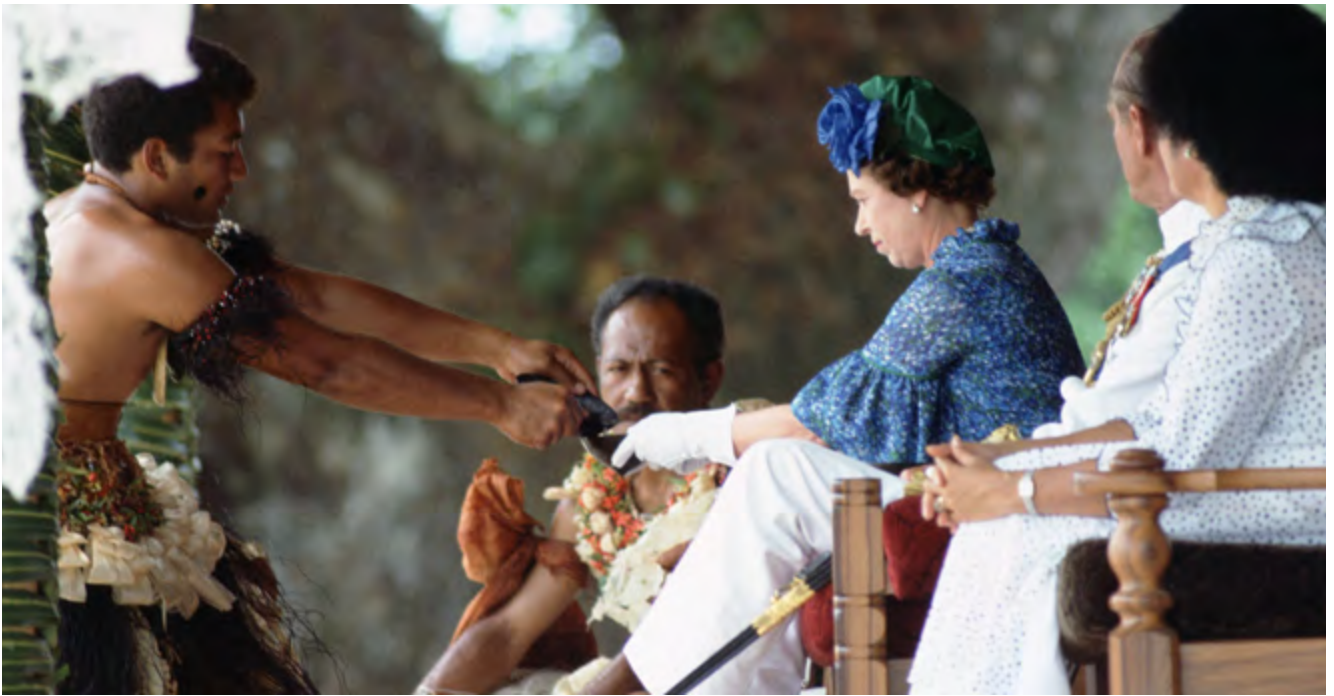
Ofrecen una bebida de Kava en 1982 a la Reina Isabel II, al visitar Fiji.

cocaína, que se consideraba una opción de estilo de vida. 44 Y existe una especie de lógica circular en Nigeria, donde muchas personas afirman que las drogas conducirán a la gente a la locura, mientras que al mismo tiempo creen que las drogas solo las toman los locos. 45 Los líderes comunitarios allí se refieren a las personas que usan drogas como “inútiles”, “personas sin valor”, “irresponsables” y afirman que son una vergüenza para sus familias y su comunidad en general. 46 De manera similar, una encuesta realizada en Marruecos, Túnez, Egipto, Líbano, Pakistán y Afganistán encontró que los términos más usados para describir a las personas que se inyectan drogas son “deben ser castigados”, “malvados/malas personas”, “falta de respeto/irrespetuoso” y “culpable”. 47