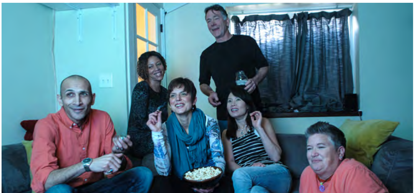
Personas compartiendo un cigarro de marihuana mientras ven una película.

El gobierno de los EE.UU. llevó a cabo un estudio a principios del siglo XX, antes de que los opiáceos y las drogas basadas en cocaína se volvieran ilegales, de personas con