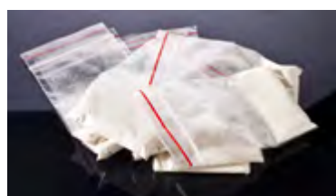
Heroína de pureza y potencia desconocida, como se vende en las calles hoy en día.