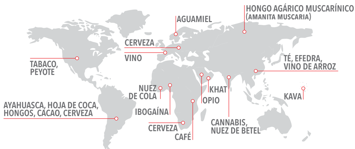
FIGURA 2: USOS TRADICIONALES DE DROGAS ALREDEDOR DEL MUNDO